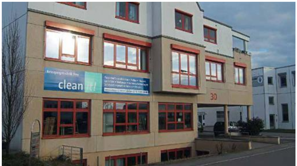
Reinigungstechnik Frey ist auf die Reinigung von textilem Sonnenschutz spezialisiert.

Nicht zu vernachlässigen ist das alltägliche Buchen. Um zeitsparend zu arbeiten, hilft ein übersichtlicher Aufbau der Software: Dank moderner und flexibler Oberflächengestaltung lassen sich Funktionsmenüs